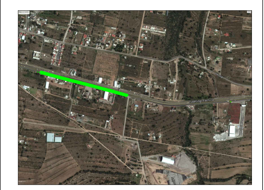
CARRETERA PACHUCA-TULANCINGO, MINERAL DE LA REFORMA, HIDALGO